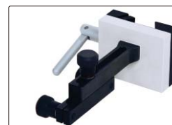
杠杆表夹表附件(标配)